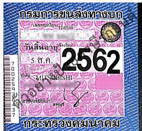
ตัวอย่างป้ายภาษี